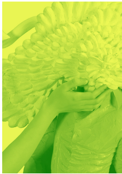
「雲霧—エクトプラズムの群像」(高見直宏)