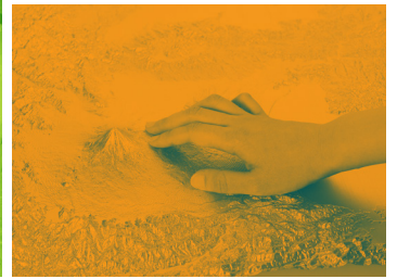
「富士山立体地図」(株式会社三木製作所所蔵)