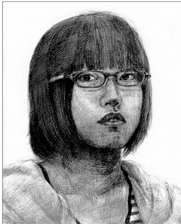
②自画像（鉛筆・2時間）