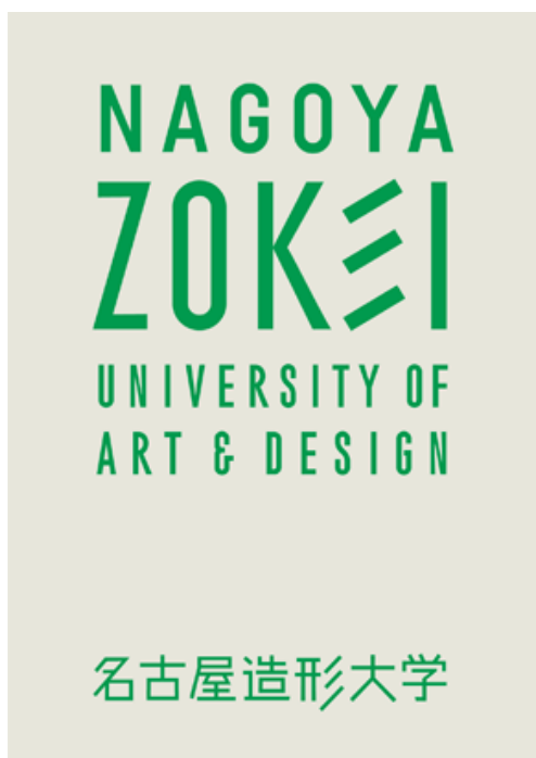
図 I-1 本学ロゴタイプ

本学では、カタチを、「カタ」に「チ」(知、智、血、命)を吹きこむことであると捉え、そこに、① 本来あるべき形を提案すること、② カタに「いのち」を入れること、③ 社会的な課題の解決の形を見つけること、④ 伝統に新しい「知」を吹き込むこと、といった意味を込めている。図 I-1 のように、本学のロゴタイプでは彡(さんづくり)を強調し、本学が新しい「カタ・チ」を造る大学であることを象徴的に示している。