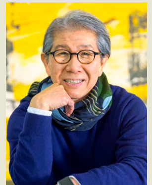
やま もと り けん 山本 理顕 名古屋造形大学 学長 建築家

1957年生まれ。西友ストアー長野(現合同会社西友)を経て1993年良品計画入社。生活雑貨部長として長い間、売上の柱となる生活雑貨を牽引し良品計画の成長を支える。その後、常務取締役営業本部長として良品計画の構造改革に取り組む。2008年2月代表取締役社長、2015年5月代表取締役会長に就任、現在に至る。西友時代より「無印良品」に関わり、一貫して営業、商品分野を歩み、良品計画グループ全体の企業価値向上に取り組む。